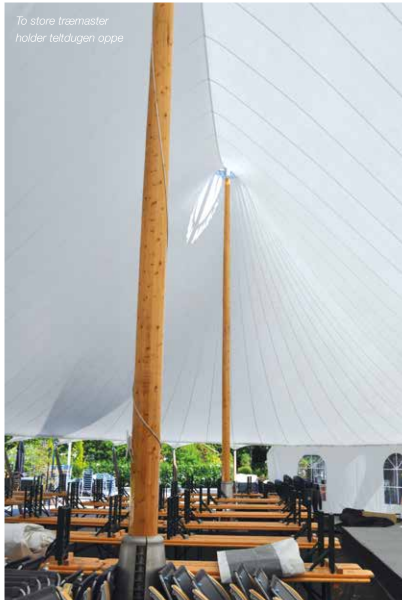
To store træmaster holder teltdugen oppe